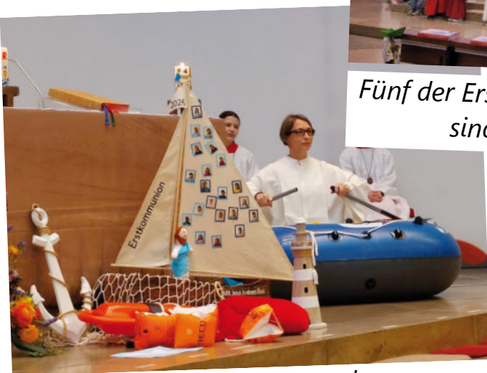
Um im Leben vorwärts zu kommen, braucht man die beiden „Ruder“ Gottes- und Nächstenliebe