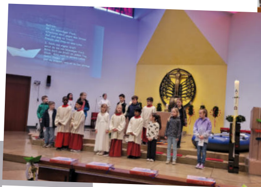
Fünf der Erstkommunionkinder sind jetzt Minis