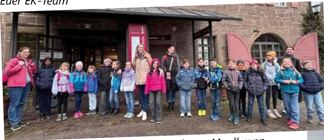
Gruppenfoto vor dem Kloster Maulbronn, wohin der Erstkommunionausflug ging