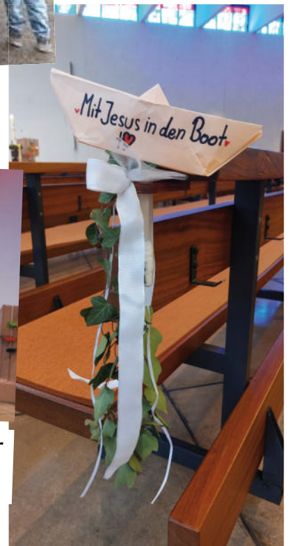
Das Motto der Erstkommunion fand sich sogar in der Bank- dekoration wieder