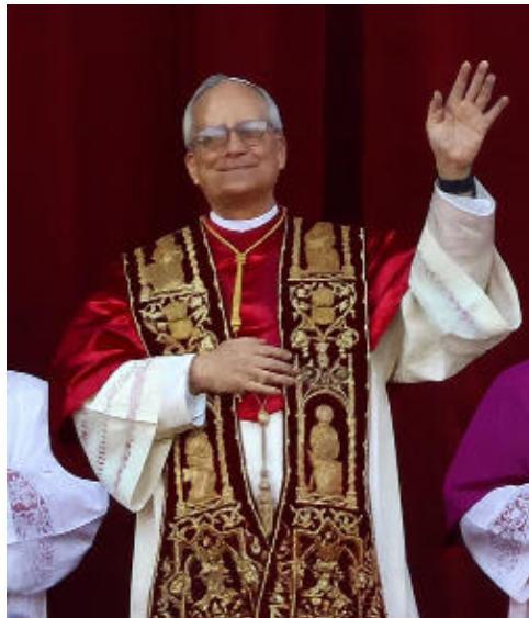
Papst Leo XIV. am Tag seiner Wahl auf der Loggia des Petersdoms

Papstnamen Hadrian V. Doch er starb, bereits erkrankt, bevor er überhaupt die Priester- und Bischofsweihe erhalten hatte, am 18. August in Viterbo. Er war nur 38 Tage im Amt, immerhin fünf Tage länger als Johannes Paul I. im Jahr 1978. Auf den Theologen Innozenz und den Diplomaten Hadrian folgte nun der